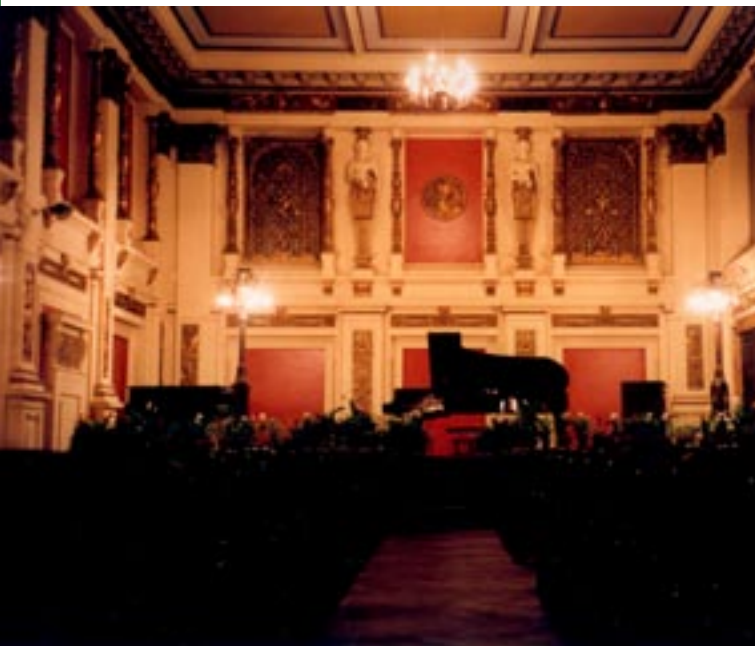
Ehrbar-Saal, Wien/Ehrbar Hall, Vienna

Freie Teilnahme und Unterkunft beim Wettbewerb im Juni 2009