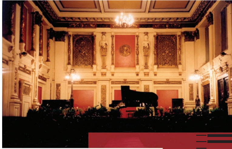
Vienna International Pianists