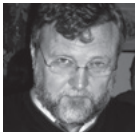
George Borisov (Russia/USA)

Der erfolgreiche Pianist und Pädagoge ist in Festivals und Wettbewerbsjürys weltweit tätig. Er ist Gründer und Präsident des „Golden Key Music Festivals“ in der Carnegie Hall.