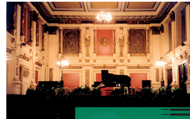
Vienna International Pianists